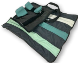
Borsa organizer per elementi