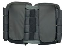
fig.1: retro schienale

Per adattare lo schienale SENSO INPOCKET al tronco procedere come segue: